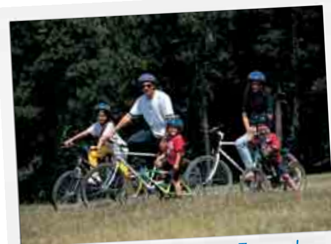
¡Una excursión en bici por La Toscana!

Desayuno. A la hora indicada, nos dirigiremos al aeropuerto, donde dejaremos el coche de alquiler para tomar nuestro vuelo de la compañía Meridiana. Llegada a Barcelona .