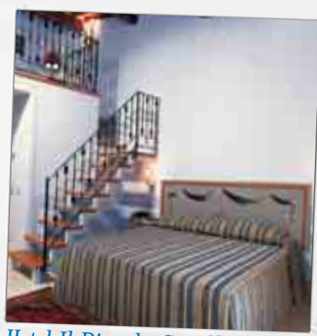
Hotel Il Piccolo Castello