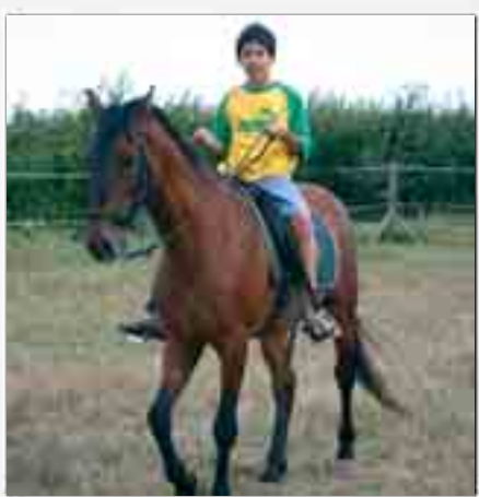
Un paseo a lomos de un caballo.