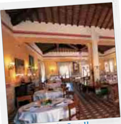
Hotel Il Piccolo Castello