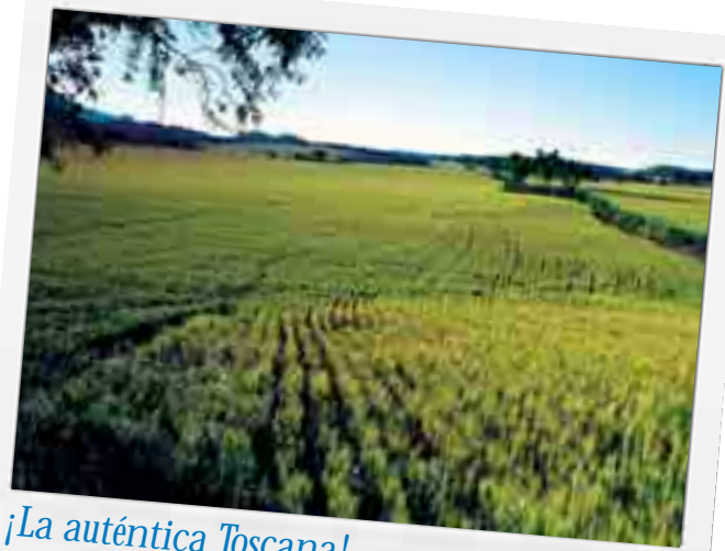
¡La auténtica Toscana!