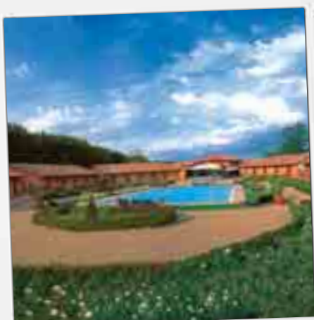
Hotel Il Piccolo Castello