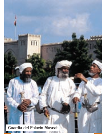
Guardia del Palacio Muscat

Notas de salida: (GF): Madrid/Barcelona/Bilbao. Tasas no incluidas.