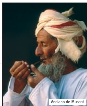
Anciano de Muscat