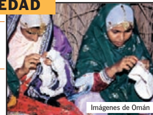
Imágenes de Omán

Descubra los encantos de Omán conduciendo su propio todoterreno, desde la mística Muscat, el desierto de Wahiba, las fortificaciones del siglo XVII en el interior o el Gran Cañón en las montañas de Shams. Un programa pensado para moverse con total libertad.