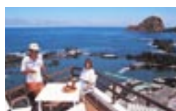
RESIDENCIAL CALHAU 9270 Porto Moniz Tel.: 853104