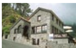
RESIDENCIAL ENCUMEADA Feiteira, Serra de Água 9350 Ribeira Brava Tel.: 291 95 12 81/2