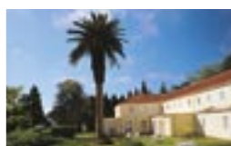
HOTEL DO SANTO Sítio dos Casais Próximos 9200 San Antonio da Serra Tel.: 552611