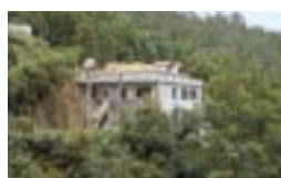
RESIDENCIAL CURTADO 9230 Santana Tel.: 572240