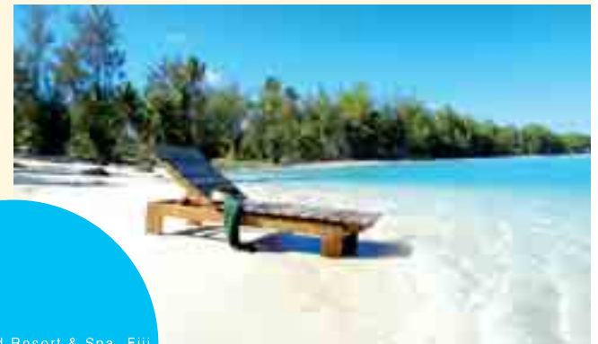
Yasawa Island Resort & Spa, Fiji

Su increíble ubicación permite realizar una gran cantidad de tratamientos fusionando el mar y el alma en un mismo ritmo.