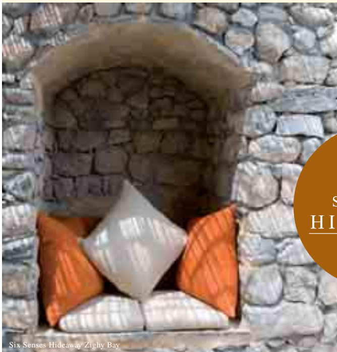
Six Senses Hideaway Zighy Bay