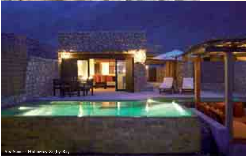
Six Senses Hideaway Zighy Bay