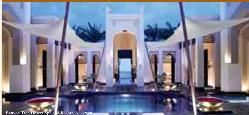
Banyan Tree Desert Spa and Resort, Al Areen

5 noches de estancia en habitación doble y desayuno. Vuelo en clase turista con la compañía Air France. Traslados privados aeropuerto hotel aeropuerto. Tratamiento "Four hands Massage". Documentación práctica, set y seguro de viaje.