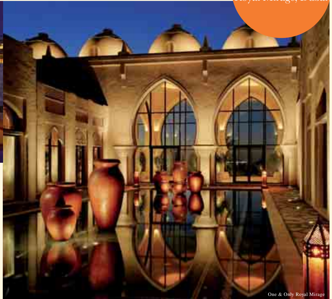
One & Only Royal Mirage

Un viaje maravilloso con altos pasillos enmarcados por los arcos arabescos que conducen al corazón del Hammam Oriental... un asilo del espacio, del calor y de la comodidad. El sonido relajante del agua acariciando las paredes adornadas hace que su estancia se convierta en un oasis de relajación y de bienestar.